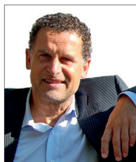
Henk Buteijn Fotograaf, specialisme mondfotografie